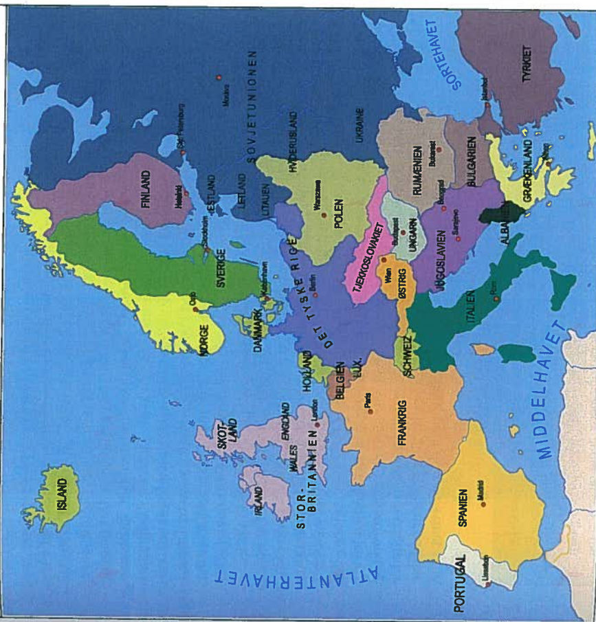
EUROPA EFTER FØRSTE VERDENSKRIG

Palæstina, Irak). Under imperiets sammenbrud forsøgte Grækenland at erobre dele af det egentlige Tyrkiet, som havde en stor græsk befolkning. Det slog fejl, men krigen mellem Grækenland og Tyrkiet betød, at der først sluttedes en endelig fredstraktat med Tyrkiet i 1923.