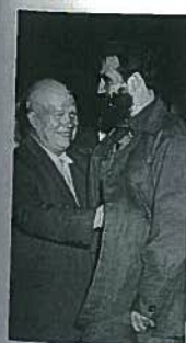
Efter den cubanske revolution i 1959 gled Cuba over i den sovjetiske lejr. Den sovjetiske leder Nikita Khrushchev omfavner den cubanske præsident Fidel Castro. Foto 1960.

På trods af russernes anstrengelser beholdt USA det strategiske overtag, først og fremmest fordi USA rådede over så mange